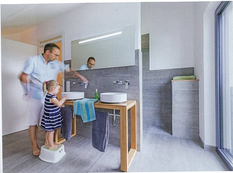
DAS BADEZIMMER ist mit hellgrauen Steinzeugfliesen und einem Doppelwaschtisch puristisch eingerichtet – ein Stil, der perfekt zur zeitgemäßen Architektur passt.

Wichtig war der Baufamilie eine enge Verzahnung von Innen- und Außenraum. Über eine große schwellenfreie Alu-Holz-Schiebetür gelangt man vom Essbereich auf die weitläufige Holzterrasse und mit ein paar wenigen Schritten zum Freiluft-Sitzplatz. Dieser wird auf einer Seite von Pflanztrögen aus edelrostigem Stahl begrenzt, in denen zwischen buschigen Gräsern duftender Lavendel blüht.